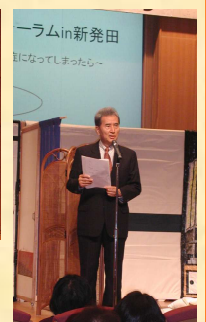
認知症地域フォーラムin新発田の様子です