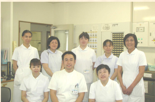
スタッフの皆さんです

認知症の方とのコミュニケーション技法の一つに「バリデーション」というものがあります。聞きなれない方もいらっしゃるかと思いますが、この技法では認知症の患者さんが衰えにくいとされる感覚や感情に焦点をあててコミュニケーションを図っていきます。私達はこうした技法を取り入れながら、患者さんに落ち着きを取り戻していただき、またご家族のご理解とご協力をいただきながら、自宅または施設への退院を目指しております。